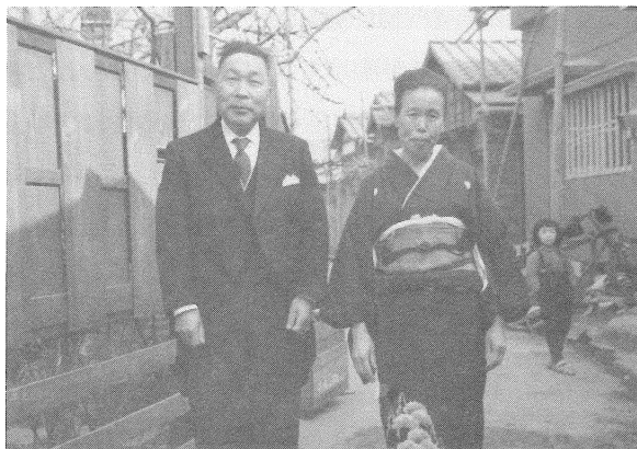
昭和33年当時の父母

幸いDNAにも、たいした不具合もなく、73歳まで健康に生きてこられた。これもご先祖はじめ、これまで世話になった方々のおかげである。これからは何かできることをして、社会に、大げさに言えば地球に恩返しをしたい。