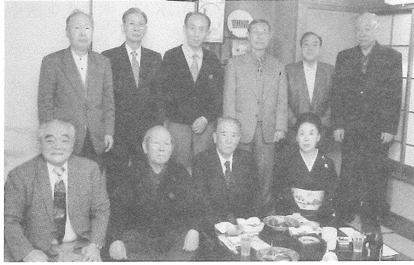
日大高等工学校の同窓会