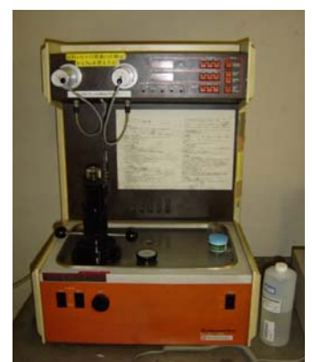
写真-2 水銀ポロシメーター